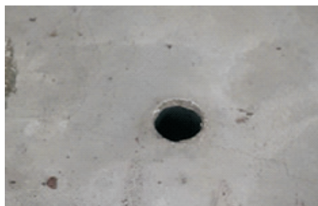
图2 水泥面成孔 Fig. 2 Cement hole

实验能够成功地喷出稳定的孔,且孔眼近似圆形(图2)。为了能够清晰地观察到孔道内部的形状,将实验后的煤样剖开,更方便地研究成孔形状以及测量孔的表征参数。