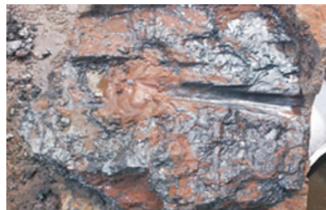
图3 煤岩成孔剖面 Fig. 3 Profile of coal hole

的成果相符合。高压水射流刚开始破碎煤岩的时候,由于成孔深度很浅,煤屑和磨料颗粒等可以向开阔的空间溅出,随着孔深的逐渐增大,煤屑和磨料颗粒反溅的空间逐渐被挤压,它们只能作用于孔壁,从而对附近的孔壁产生磨蚀,最终随着颗粒反溅出孔,会对整个孔壁都产生磨蚀作用,形成了由圆形截面和V形垂面组成的倒锥形的孔,而且孔内壁十分光滑,也证明了反溅颗粒的磨蚀作用。